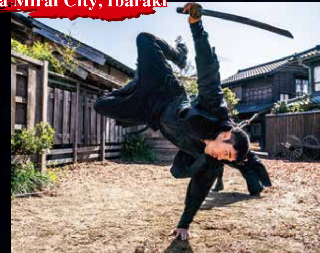
ワープステーション江戸 WARP STATION EDO