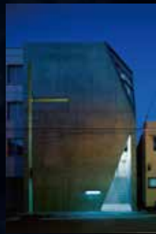
上方落語協会会館 KAMIGATARAKUGO building

The scene between Storm Shadow and Akiko as they were riding motorcycles was filmed on Iwasakibashi (Iwasaki Bridge), which connects Taisho and Nishi Wards.