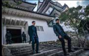
岸和田城 Kishiwada Castle