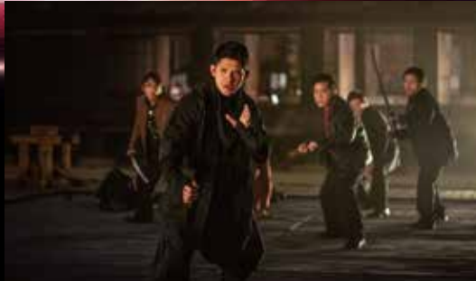
しょしゃざんえんぎょうじ 書寫山圓教寺 Shoshazan Engyo-ji Temple

At the Kameyama-gobo Hontoku-ji Temple, the great hall, omote-shoin (the main drawing room), kuri (the living quarters), and the like were used as the setting for the Arashikage compound, which was equipped with a high-tech plant. The rooms were decorated with magnificent works of art.