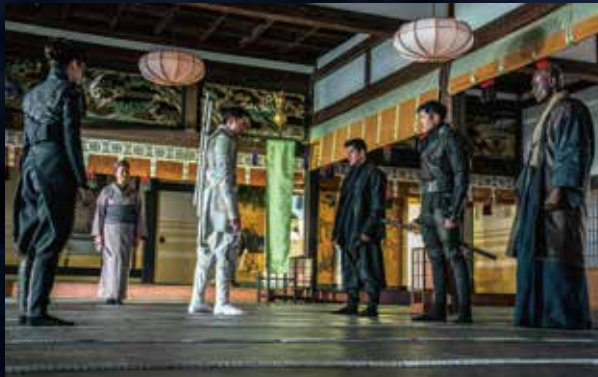
かめやまごほうほんとし 亀山御坊本徳寺 Kameyama-gobo Hontoku-ji Temple