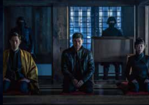
ひめじじょう 世界遺産・国宝 姫路城 Himeji Castle